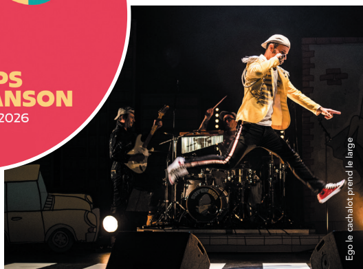
Ego le cachalot prend le large