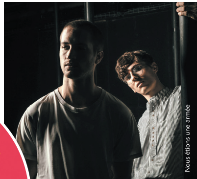
Nous étions une armée