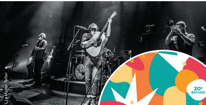
La Maison Tellier